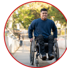
Rheoliadau Deddf Cydraddoldeb 2010 (Dyletswyddau Statudol) (Cymru) 2011