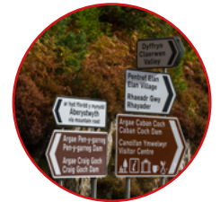
Mesur y Gymraeg (Cymru) 2011