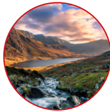
Deddf yr Amgylchedd (Cymru) 2016

Mae amrywiaeth eang o ddeddfwriaeth a pholisiau perthnasol, sy'n ein helpu i gyflawni ein nodau, wedi dylanwadu ar ein Cynllun Datblygu Cynaliadwy, gan gynnwys: