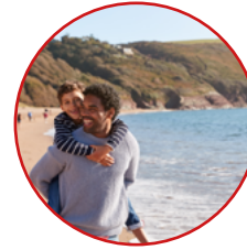
Deddf Llesiant Cenedlaethau'r Dyfodol (Cymru) 2015