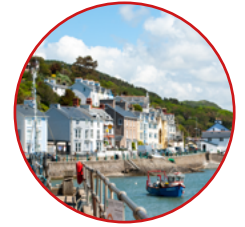
Bil Partneriaeth Gymdeithasol a Chaffael Cyhoeddus (Cymru) 2022